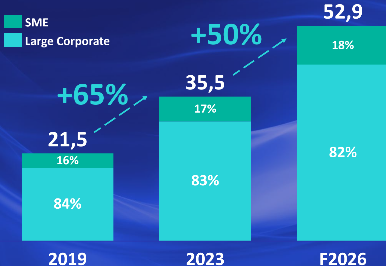
Volumi Transato Carte Commercial Italia (EUR, Miliardi)

Mercato in forte crescita nonostante le contingenze esogene